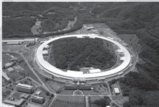
航空写真 (2020年8月撮影)

SPring-8は国内外の産学官の研究者等に開かれた共同利用施設であり、1997年より放射光を大学や公的研究機関や企業等のユーザーに提供しています。課題申請などの手続きを行い、採択されれば、誰でも利用することができます。SPring-8の運営は施設者である国立研究開発法人理化学研究所が行い、SPring-8の利用者選定業務及び利用者支援業務 (利用促進業務) を 公益財団法人高輝度光科学研究センターが行っています。